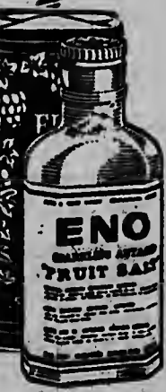
E palabranan "ENO" y "SAL DE FRUTA" ta marca nan registra

DEN SOLAMENTE 8 SECONDE, e anti-acido scumante aqul ta drecha bo stoma, refresca i limpia bo boca. Basha poco Eno den un glas di awa i bebb. Bebe regularmente un glas di e refrescante "Sal de Fruta" Eno i lo bo queda cu energia i salud, no tin nada mas mihor pa refresca bo den tempo di calor. Furba Eno i huzga pa bo mes.